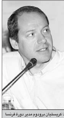
□ كريستيان بريدوم مدير دورة فرنسا